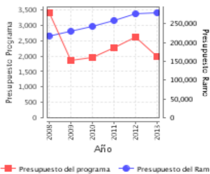
Presupuesto Ejercido Programa vs. Ramo