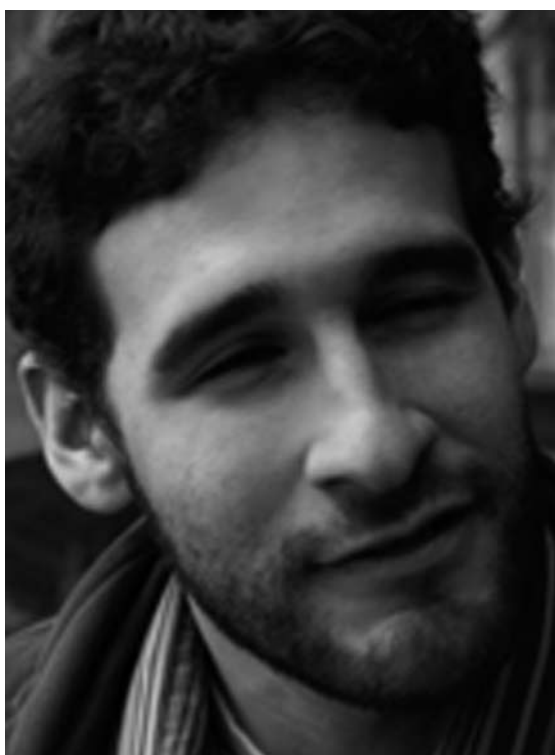
FOTOGRAFÍA DE GIBRÁN PORTELA, 2009.

"Quería hacer una historia sencilla, una historia de amor. Acababa de terminar con mi chica y decidí ir a la playa, ahí fue donde escribí la escaleta de Alaska ".