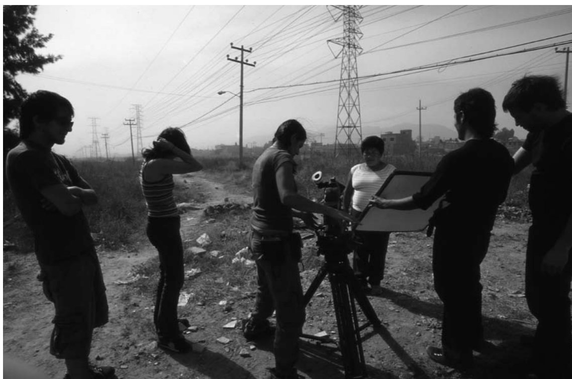
RODAJE DEL DOCUMENTAL MI VIDA DENTRO.

Dentro de la producción de un buen documental, es preciso seguir y cumplir con los procesos del cine: esbozar la idea o el tema, realizar un guión, etcétera.