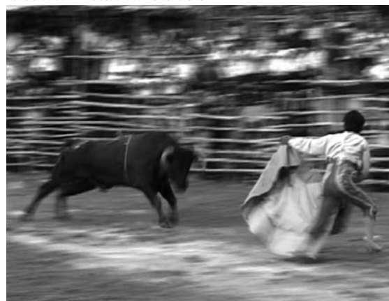
FOTOGRAMA DEL DOCUMENTAL TORO NEGRO.