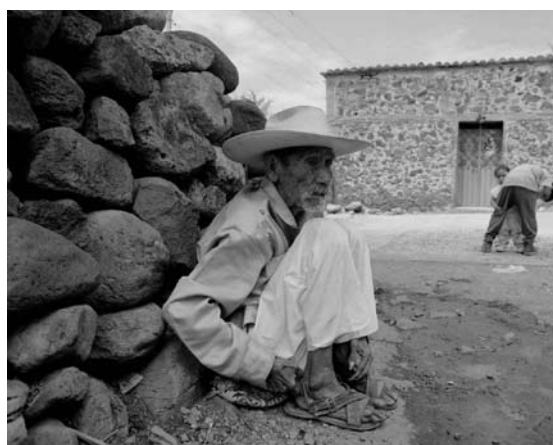
FOTOGRAMA DEL DOCUMENTAL LOS ÚLTIMOS ZAPATISTAS, HÉROES OLVIDADOS.

buena pero se lo comieron los estrenos”. Paradójicamente tuvo una gran respuesta del público, recibió correos en agradecimiento por contar ese tipo de historias.