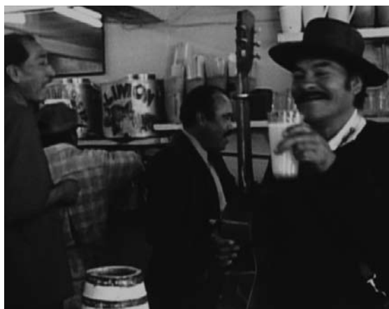
FOTOGRAMA DEL DOCUMENTAL LA CANCIÓN DEL PULQUE.

dores de documental de tres países (Estados Unidos de Norteamérica, España y México). BorDocs busca apoyar la carencia nacional de espacios formales de profesionalización en la producción documental, así como crear nuevos y diversos públicos.