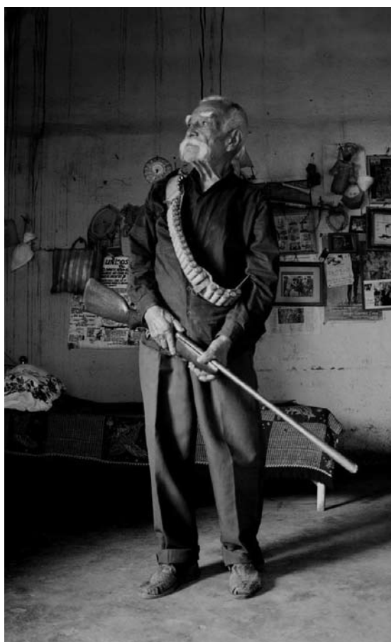
FOTOGRAMA DEL DOCUMENTAL LOS ÚLTIMOS ZAPATISTAS, HÉROES OLVIDADOS.

En un rescate inverosímil para el chilango promedio, la pulquería se muestra como una cápsula rural que pervive dentro de una impersonal megalópolis como lo es la ciudad de México. Everardo González se encarga de mostrarnos con esporádica improvisación y naturalidad en los personajes, los valores que conlleva esta realidad: el colorido, la tradición, la espontaneidad, la camaradería, la creatividad, la música, sus historias. Por otra parte, nos invita a bebernos a nosotros mismos y confrontar nuestra propia borrachera en un discurso universal que no será tan complaciente después de todo.