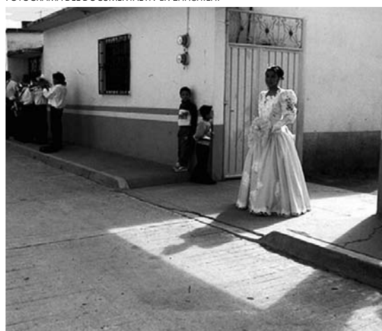
FOTOGRAMA DEL DOCUMENTAL XV EN ZAACHILA.

Paralelamente al renacimiento y evolución del documental han surgido festivales especializados en México, que han abordado de manera particular al documental, desde un espíritu altruista por parte de sus organizadores.