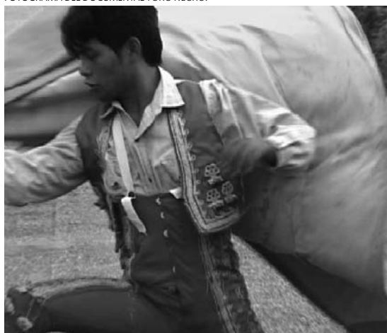
FOTOGRAMA DEL DOCUMENTAL TORO NEGRO.

El oficio del documentalista es arte que resulta costoso en inversión de tiempo y capital.