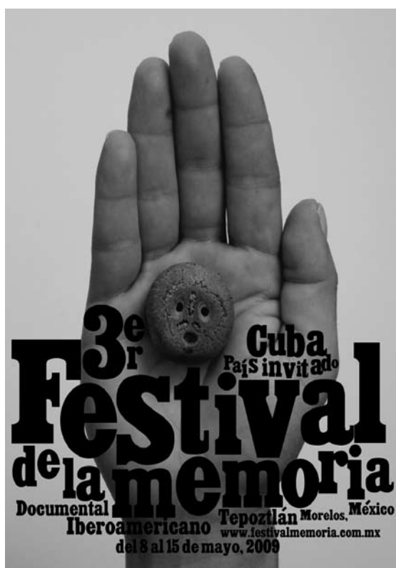
CARTEL DEL TERCER FESTIVAL DE LA MEMORIA.

Decir que no hay apoyos no es del todo real. Con pocos recursos se han realizado producciones de calidad internacional que han sido reconocidas y premiadas.