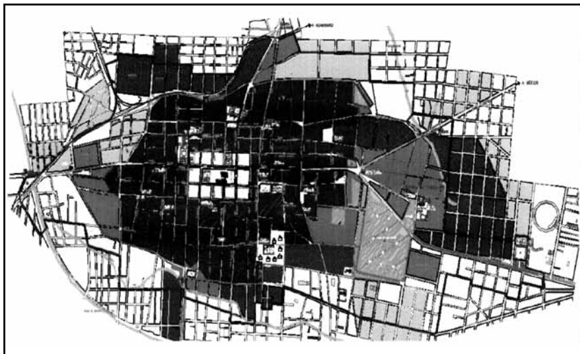
Gráfica 1. Crecimiento histórico de Morelia 1541-1940

El crecimiento de la población fue lento hasta la década de los ochenta. A raíz de los sismos de 1985 se registró un movimiento migratorio intenso desde la Ciudad de México: la población inmigrante de carácter urbano planteó demandas de vivienda, infraestructura y equipamiento que la ciudad de Morelia no estaba en condiciones de satisfacer.